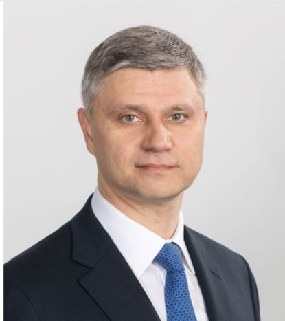
Олег Белозёров, генеральный директор, председатель правления, ОАО «РЖД»